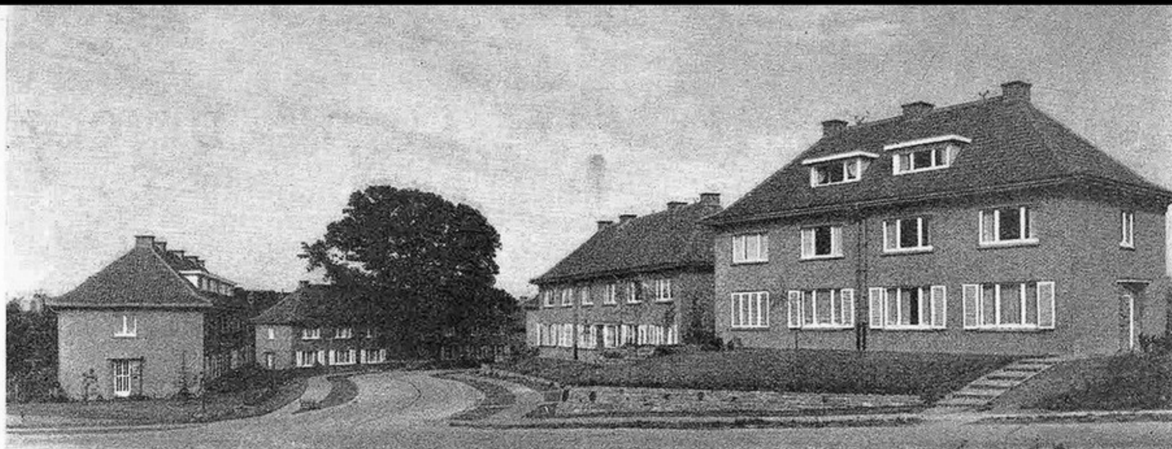
Maisons du type AB.